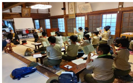
前回、寺院参拝の写真より

※その後、郵送されて行きます「参加申込書」と「宗教章授与申請書」の提出期限は4月14日(金) 厳守(必着)となります。返信先は「宗教章取得講習会についてのご案内」にてお知らせいたします。