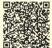
講座申込用 QR コード