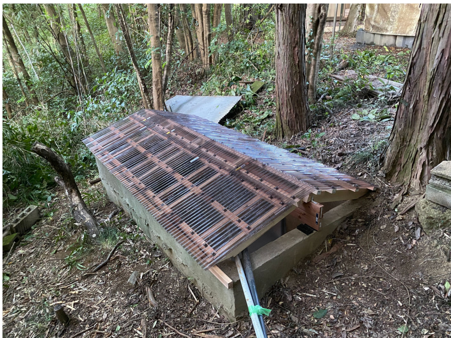
受水槽の屋根 完成した状態