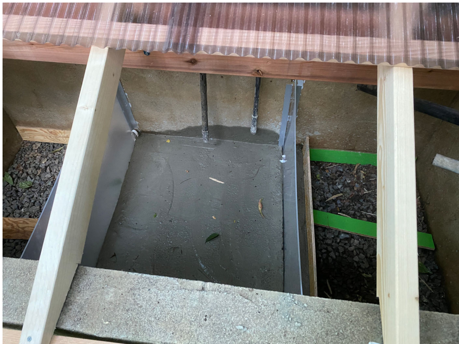
中の仕切り 仮止め状態