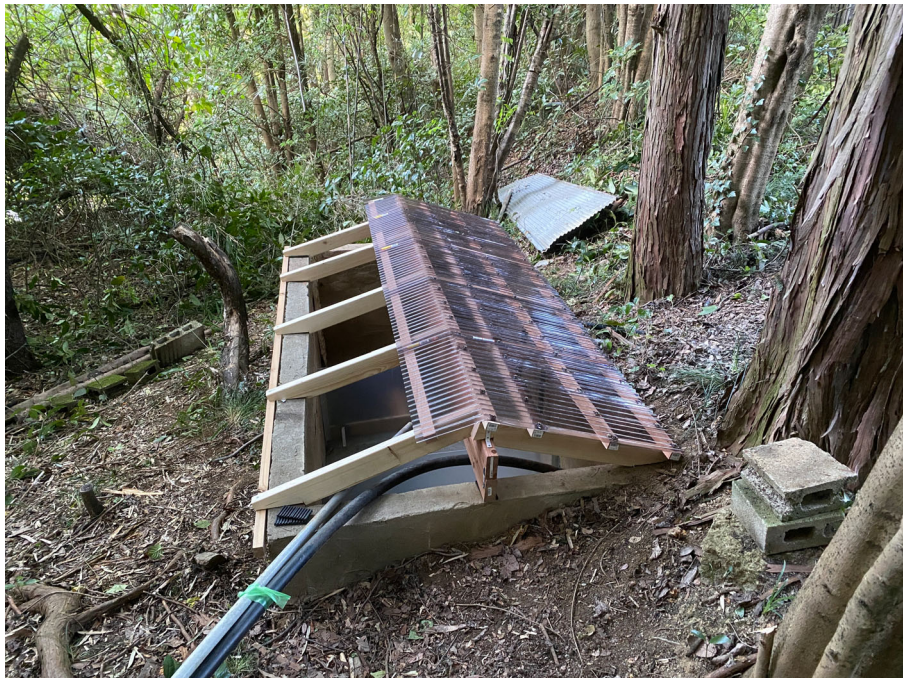
受水槽の屋根 点検用に 片側の屋根を 外した状態