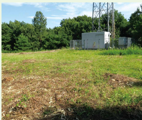
▲武甲サブキャンプ