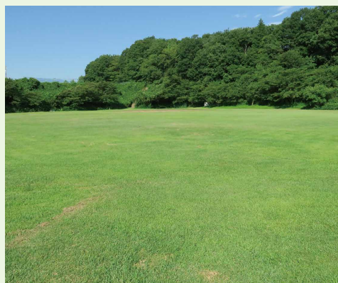
▲赤城サブキャンプ