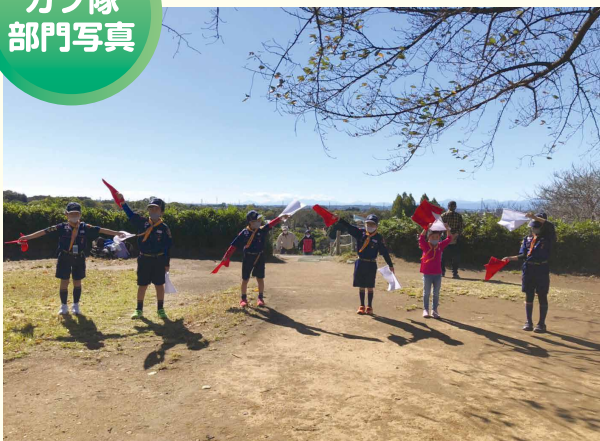
金賞 さいたま第104団カブスカウト隊1組 「カブ集合!1・2・3・4・5・6」